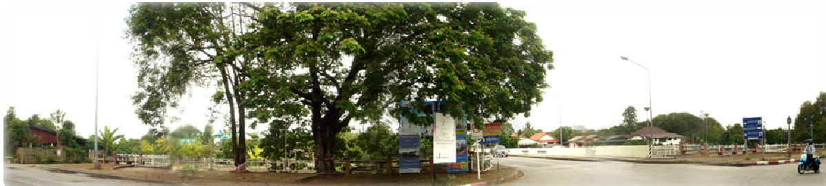
การสำรวจ วางแนวก่อสร้าง